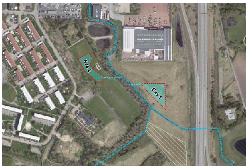
Figur 1 Princip placering af okkerudfældningsbassin

Grundvandssænkningen skal udføres med okkerudfældningsbassiner med principiel placering som vist på Figur 1 Princip placering af okkerudfældningsbassin. Placering er nærmere angivet på tegning 3.201 Byggepladsplan, og kan præciseres af Herning Kommunes tilsyn.